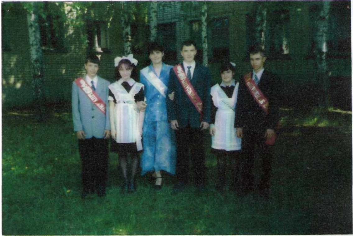
Прощальный праздник- Последний звонок. 2002 г.