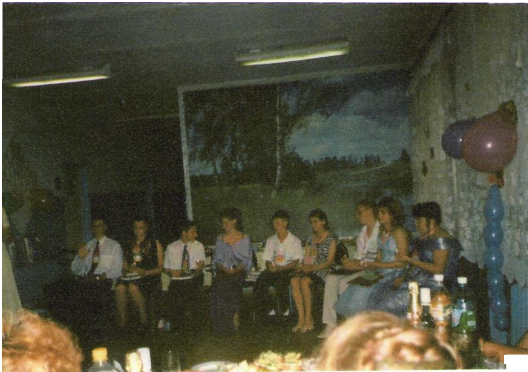
Выпускной вечер в 9 классе. 2007 г.