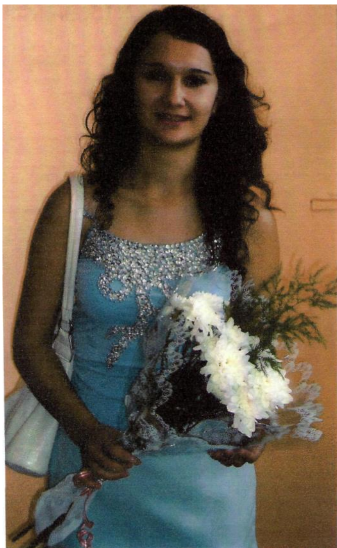
Перед вручением диплома, 2007 г.