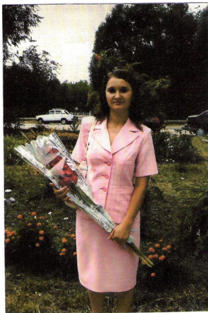
Первая педагогичес- кая конферен- ция, 2007 г.