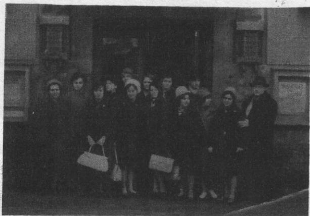
Работа в пионерлагере пионервожатой во время каникул в Александровке. 1962 г.