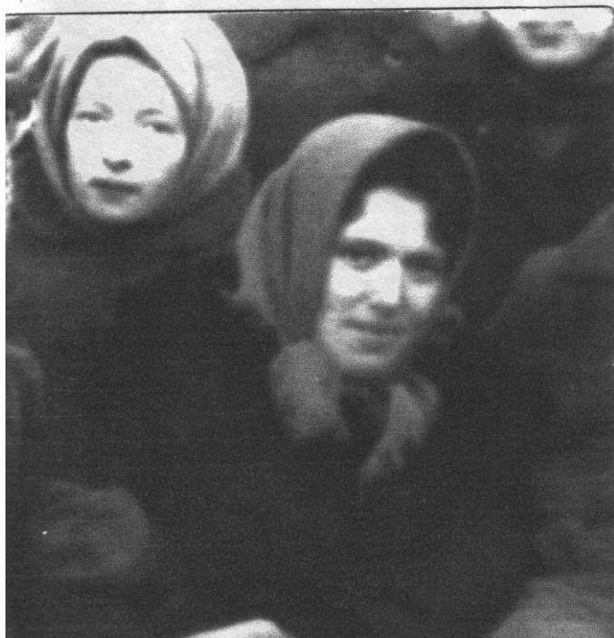
На уборке картофеля с учениками. 1966 г.