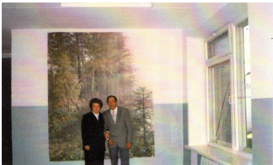
Первое сентября 1997 г.