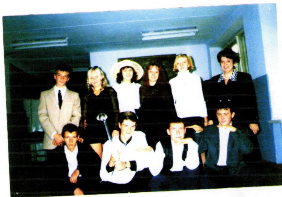
5 октября 1999года день Учителя.