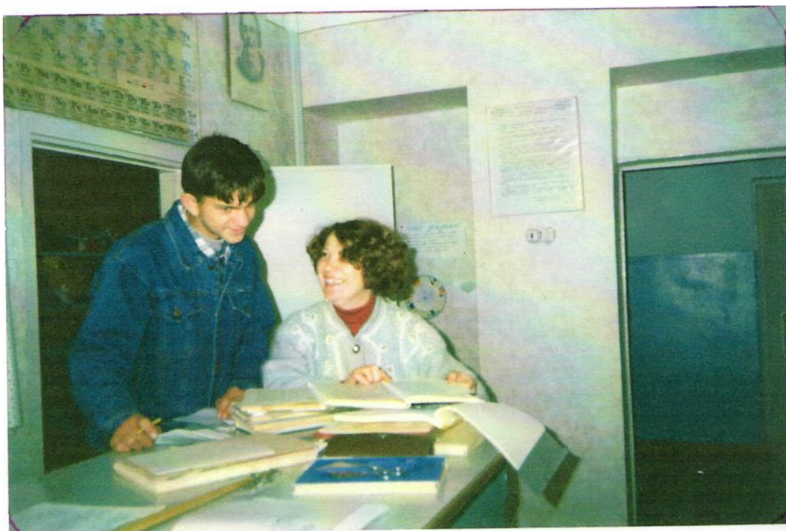
Сентябрь 2000 г.