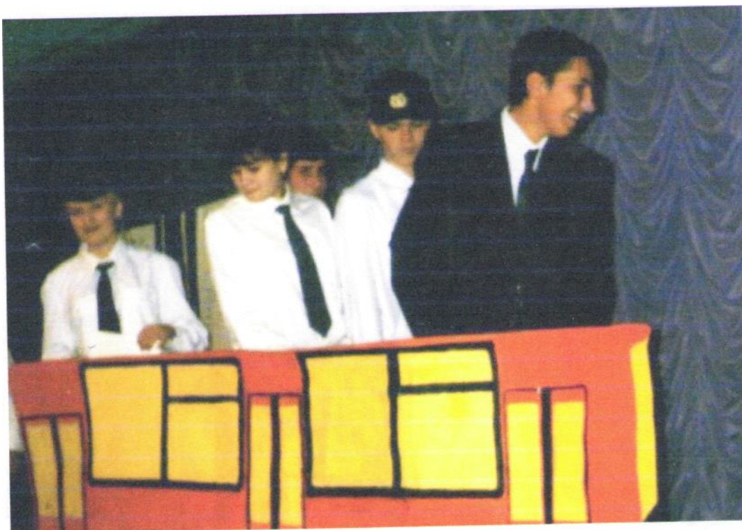
Первое выступление на конкурсе агитбригад. Осень 1999г.