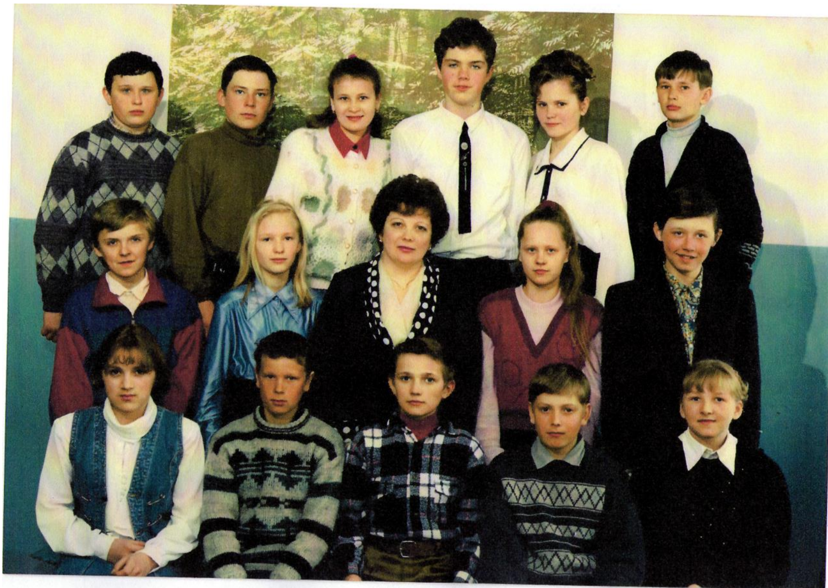
Самый классный класс! 2000 г.